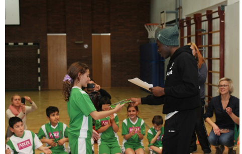
Bilder vom Feriencamp Weihnachten 2013